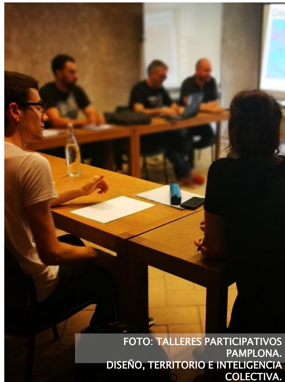
FOTO: TALLERES PARTICIPATIVOS PAMPLONA. DISEÑO, TERRITORIO E INTELIGENCIA COLECTIVA.