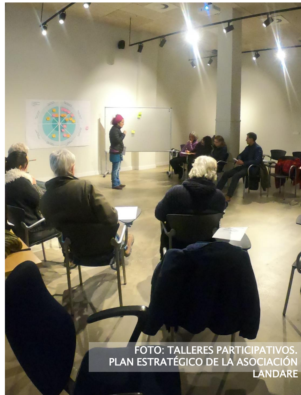
FOTO: TALLERES PARTICIPATIVOS. PLAN ESTRATÉGICO DE LA ASOCIACIÓN LANDARE