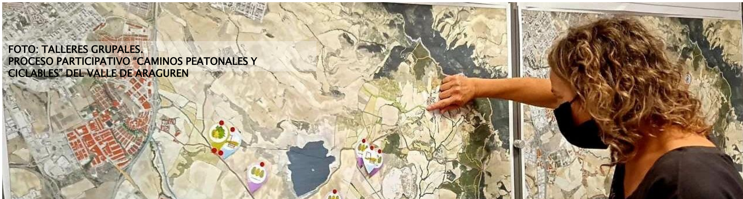
FOTO: TALLERES GRUPALES. PROCESO PARTICIPATIVO "CAMINOS PEATONALES Y CICLABLES" DEL VALLE DE ARAGUREN

-Fase 3. Implementación, desarrollo y seguimiento de la estrategia.