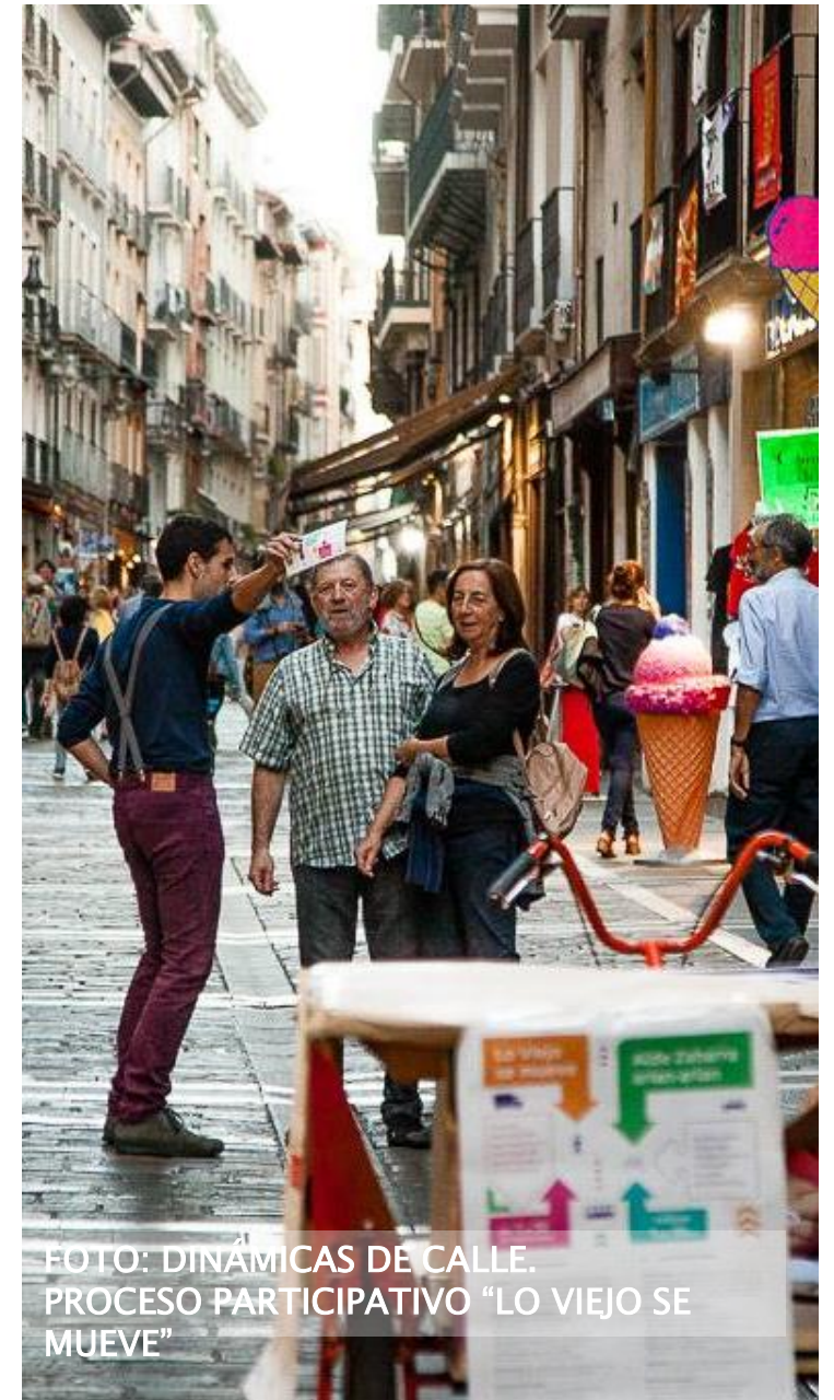
FOTO: DINÁMICAS DE CALLE. PROCESO PARTICIPATIVO "LO VIEJO SE MUEVE"